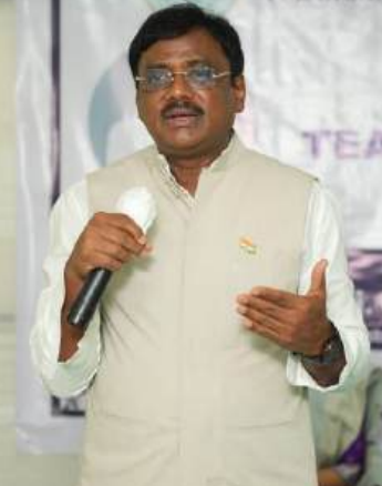
(మిగతా 2వ పేజీలో)

నిర్వహిస్తున్నట్లు తెలిపారు. నర్సింగ్, ఇంజనీరింగ్ తదితర రంగాల్లో జర్నల్లో మంచి వేతనాలతో కూడిన ఉపాధి అవకాశాలు అందుబాటులో ఉన్నాయని మంత్రి పేర్కొన్నారు. కొత్త భాషను నేర్చుకుని జర్నల్ పంపిణీ అభివృద్ధి చెందిన దేశాల్లో ఉద్యోగాలు సాధించడం యువతకు గొప్ప అవకాశమని అన్నారు. ఇటీవల మందమరెడ్డి ప్రారంభించిన జర్నల్ భాషా శిక్షణ తరగతులకు విశేష స్పందన లభించిందని తెలిపారు. మందమరెడ్డి కేంద్రంలో ఇప్పటికే సుమారు 200 మంది యువత జర్నల్ భాషా కోర్సులో చేరినట్లు వెల్లడించారు. విద్యార్థుల హాజరును నిరంతరం పర్యవేక్షిస్తూ