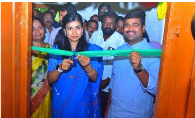
ప్రజా పాలనలో ప్రజలు సంతోషంగా ఉన్నారు.