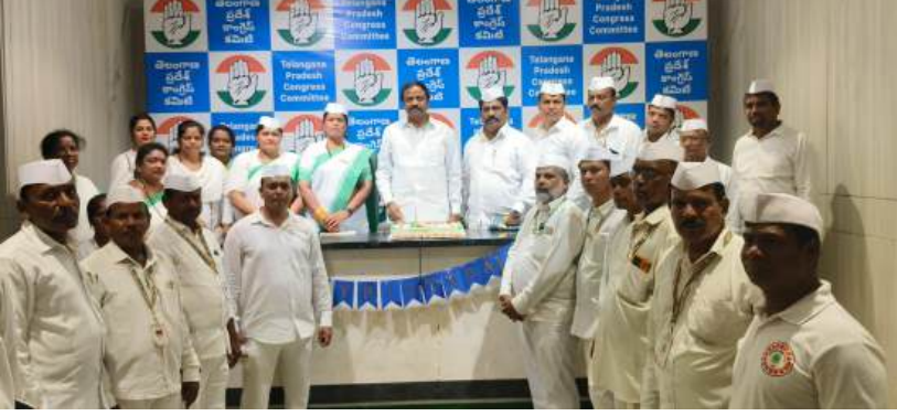
ప్రజానాయకుడని కొనియాడారు. ఈ సందర్భంగా రాహుల్ గాంధీకి జన్మదిన శుభాకాంక్షలు తెలియజేస్తూ ఆయనకు సంపూర్ణ ఆయురారోగ్యాల, దీర్ఘాయుష్య కలగాలని ఆకాంక్షించారు. ఈ కార్యక్రమంలో కాంగ్రెస్ పార్టీ సీనియర్ నాయకులు, సేవదళ రాష్ట్ర, జిల్లా, నియోజకవర్గ, మండల నాయకులు, కార్యకర్తలు మరియు అభిమానులు పెద్ద సంఖ్యలో పాల్గొన్నారు.