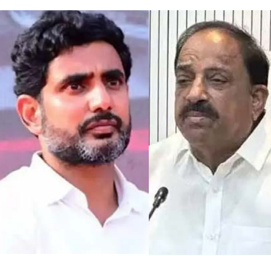
ఫోన్ ట్యూపింగ్ కేసులో కీలక పరిణామం..