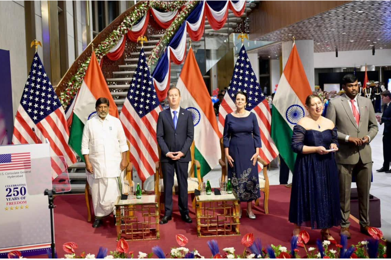
కాన్సులేట్ సమీపంలో ఒక రహదారికి "డానాల్డ్ ట్రంప్ అవెన్యూ"గా పేరు పెట్టే ప్రతిపాదనను కూడా ఆయన ప్రస్తావించారు. ఇది తెలంగాణ--అమెరికా స్నేహానికి గుర్తుగా నిలుస్తుందని తెలిపారు. అమెరికా ప్రజలకు స్వాతంత్ర్య దినోత్సవ శుభాకాంక్షలు తెలియజేస్తూ, ద్వైపాక్షిక సంబంధాలను మరింత బలపరచేందుకు తెలంగాణ కట్టుబడి ఉందని భట్టి విక్రమార్కు అన్నారు.